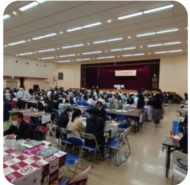
大阪市内 進学イベント

2022年度の輪母ネットワークは、任意団体時からの従来のピアコミュニティとしての取り組みを大切にしながら、新たなチャレンジを重ねた一年となりました。その活動を通じて、障害児者とその家族、支援者や地域住民のつながりの場と機会を多数提供することができました。