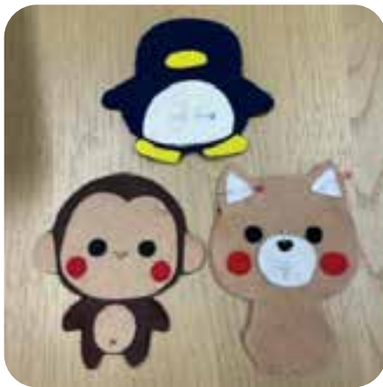
ちくちく:どうぶつマグネット

障害当事者とその家族を地域や支援者とつなぐ活動として実施している地域連携事業では、新型コロナウイルスによる感染症の影響により活動が停止していた地域ボランティア事業「ちくちく」を再開しました。また、以前より要望のあった障害児者支援をする支援者同士の交流の場として「支援者ピア」をスタートし、2回の実施で合計38名の支援者にご参加いただきました。